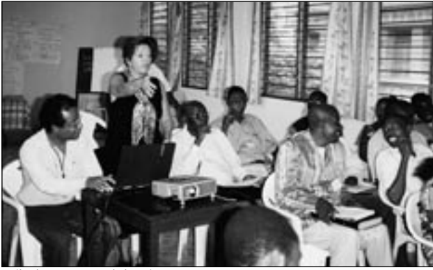
Teilnehmer am Workshop im Kongo

stark geschwächt, und bis heute hat der Staat noch kein Gewaltmonopol. Ein politisches Vakuum war in sämtlichen Bereichen des Machtapparates offensichtlich. Man hat festgestellt, dass die Initiativen der Zivilgesellschaft eine enorme Bedeutung für das Überleben der Kongolesen haben. Viele frühere Regierungsbeamte und Funktionäre waren in diese Initiativen verwickelt. Die Mitwirkung der Kommunen wuchs. Bereits damals wurde erkannt, dass man keine erfolgreiche Armutsbekämpfung betreiben kann, ohne die Kommunen zu berücksichtigen.