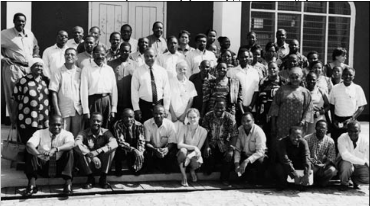
WorkshopteilnehmerInnen in Dar es Salaam über Zivilgesellschaftliche Beteiligung bei den Strategiepapieren zur Armutsbekämpfung.

Aber auch in Ländern, in denen die politische Lage bislang so gut wie keine Teilhabe der Zivilgesellschaft an nationalen Prozessen hervorgebracht hat, lassen sich zaghafte Verbesserungen der Situation ausmachen. Eine Beurteilung über positive Entwicklungen muss letztlich auch in Relation zur Ausgangssituation vorgenommen werden. In Äthiopien beispielsweise, das ergab der zweite Teil der Projektreise im Mai, wurde von allen Gesprächspartnern die Beteiligung am PRSP-Prozess als nicht wirklich partizipativ eingeschätzt. Eine noch immer restriktive Zentralregierung dominiert den Prozess, der von oben nach unten organisiert wird. Viele – insbesondere kleinere – Organisationen haben angesichts repressiver Strukturen berechtigte Angst, sich aktiv an dem Prozess zu beteiligen und politische Teilhabe einzufordern. Die internationale Initiative der Strategiepapiere PRSP hat so kaum Fortschritte erzielen können. Zivilgesellschaftliche Gruppen versuchen daher, durch ein gemeinsames Vorgehen im Rahmen von Netzwerken an Gewicht zu gewinnen und die Stimme zu erheben. Unterstützt werden sie da, wo die internationale Gemeinschaft präsent ist, vor allem in Addis Abeba, aber auch in anderen Zentren.