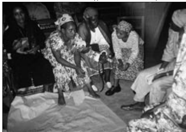
Gruppenarbeit beim Workshop in Kamerun

Kamerun hat den Entscheidungspunkt im Rahmen der Entschuldungsinitiative HIPC im Oktober 2000 erreicht. Damals