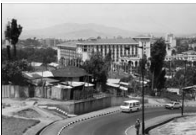
Blehhütten am Sheraton Hotel: In Addis Abeba kann man sich auch mit 5 Sternen nicht der Armut entziehen.

In den vergangenen Ausgaben des SÜDWIND-Infos haben wir immer wieder über die größtenteils enttäuschenden Erfahrungen berichtet, die unsere afrikanischen Partnerorganisationen bei der Umsetzung mit den seit dem Kölner Weltwirtschaftsgipfel 1999 eingeführten Strategiepapieren zur Armutsbekämpfung (PRSP – Poverty Reduction Strategy Papers) haben, ohne deren Erstellung es keinen Schuldenerlass gibt. Doch es gibt auch positive Entwicklungen, die wir nicht unterschlagen wollen.