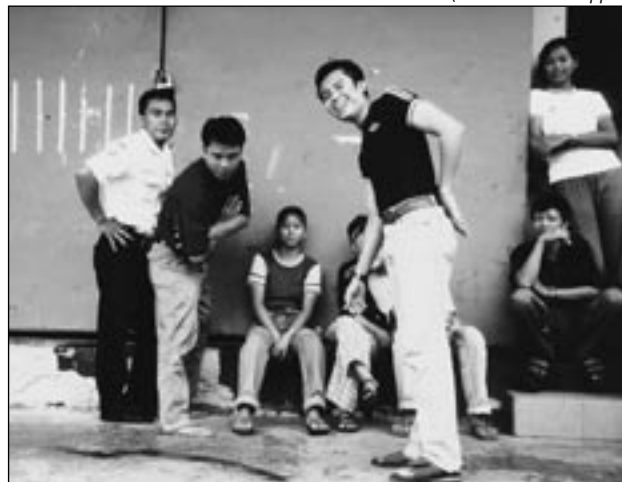
ArbeiterInnen/Sicherheitskräfte bei Megasari/Indonesien

Die vielen Millionen – überwiegend weiblichen – ArbeitnehmerInnen weltweit, die ihren Arbeitsplatz erhalten, verbessern oder überhaupt erst einen finden wollen, sind diesen Interessenkonflikten in der Regel relativ machtlos ausgeliefert. Zwar bietet ihnen dieses »Spiel um Knopf und Kragen« auch Vorteile (wie z.B. rasantes Beschäftigungswachstum in südlichen Ländern), doch gehen diese einher mit zunehmenden Nachteilen (Überausbeutung, Informalisierung, Arbeitslosigkeit etc.) – gekoppelt mit mangelndem Einfluss auf die Regeln des Spiels.