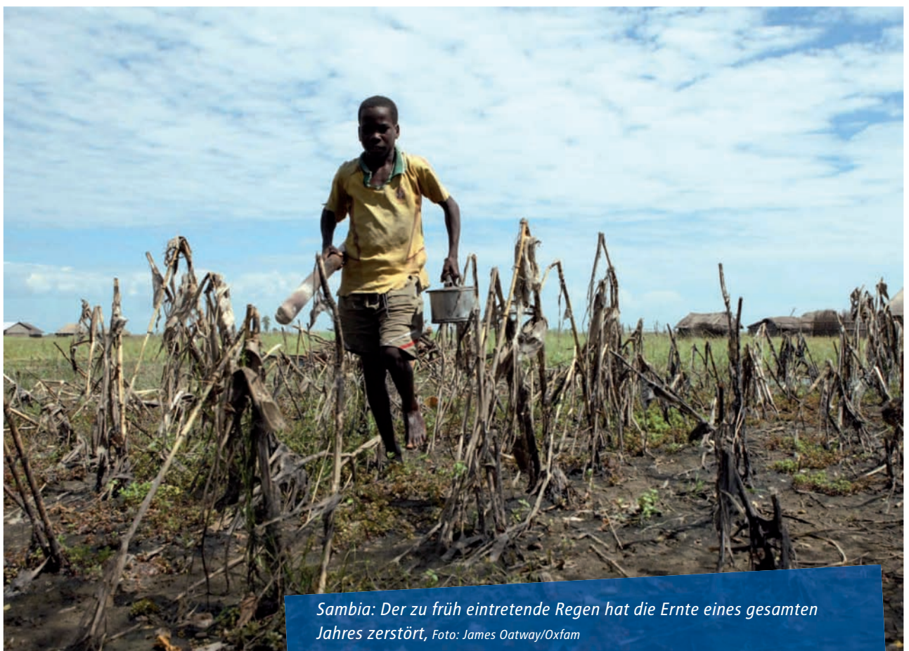
Sambia: Der zu früh eintretende Regen hat die Ernte eines gesamten Jahres zerstört.

Dies bleibt nicht ohne Folgen. Eine übertriebene Spekulation beeinflusst die Preisbildung auf den realen Weltgetreidemärkten. So geschehen im Jahr 2007/2008. Die Preise für Mais, Weizen und Reis explodierten, von Finanzspekulanten in die Höhe getrieben. Die rasant steigenden Preise für Lebensmittel haben von Asien über Afrika bis in die Karibik zu gewaltsamen Protesten geführt. Viele Menschen konnten sich Lebensmittel nicht mehr leisten. Millionen Menschen mussten hungern, weil