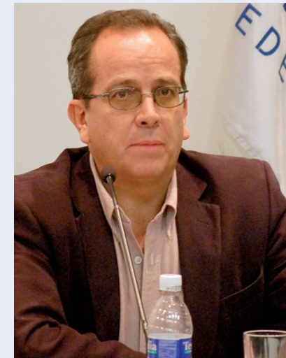
Alberto Acosta ist Wirtschaftswissenschaftler und ehemaliger Vorsitzender der verfassungsgebenden Versammlung in Ecuador

Das ist eine Herausforderung in mehrfacher Hinsicht. Zum Einen ist es eine ständige Verpflichtung, mein persönliches Leben so zu organisieren, dass ich die Harmonie mit mir selbst suche, mit meinen Mitmenschen und mit der Natur. Im Beruflichen ist es mein Engagement, dazu beizutragen, dass die Grundlagen des „Guten Lebens“ geschaffen werden; denn auch wenn der Begriff selbst aus der indigenen Gemeinschaft hervorgeht, so nährt er sich doch auch aus den wesentlichen Grundzügen des humanistischen Gedankengutes. In meiner politischen Arbeit ist es ein Aufruf, ohne Unterlass am Aufbau einer demokratischen Gesellschaft mitzuwirken.