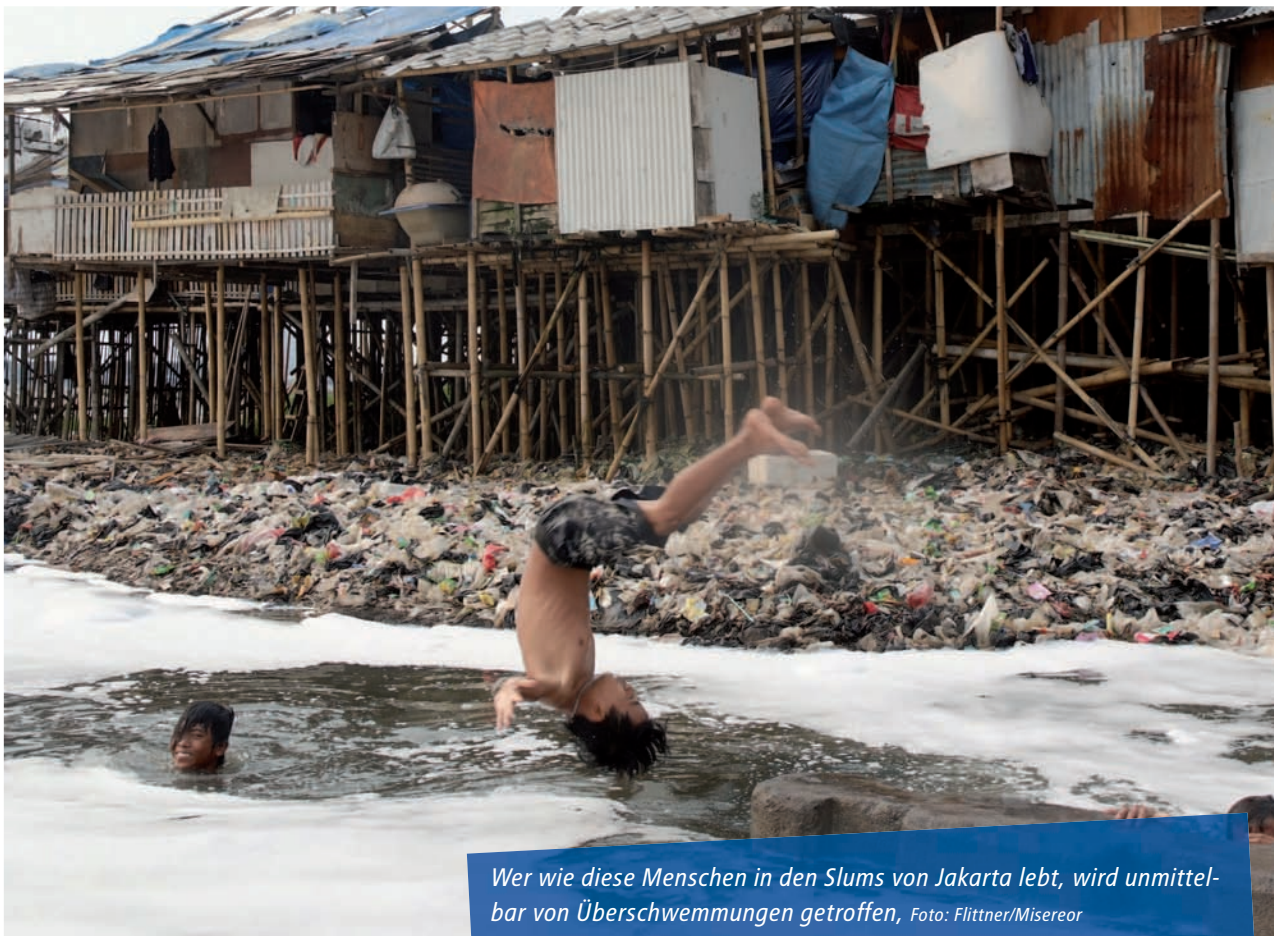
Wer wie diese Menschen in den Slums von Jakarta lebt, wird unmittelbar von Überschwemmungen getroffen