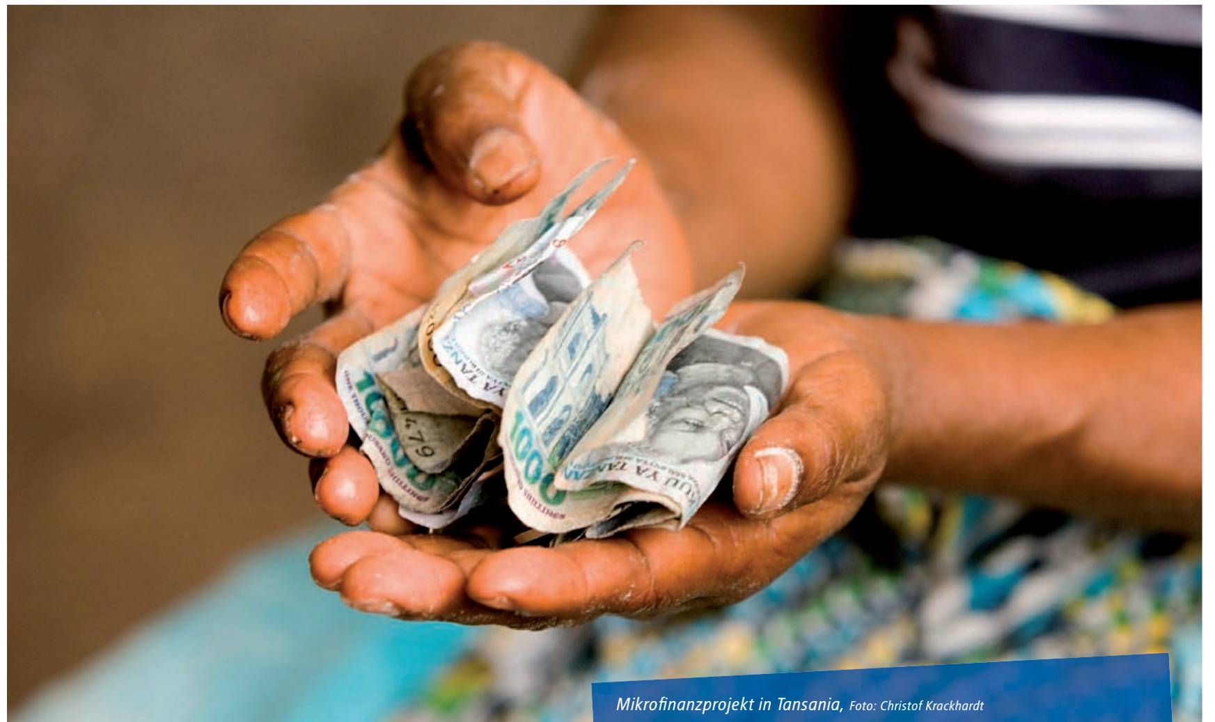
Mikrofinanzprojekt in Tansania, Foto: Christof Krackhardt