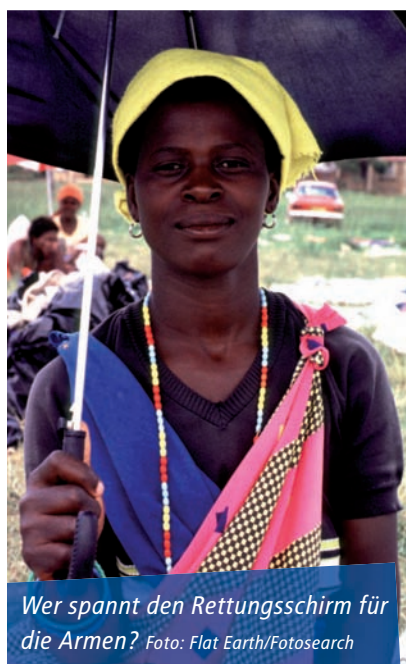
Wer spannt den Rettungsschirm für die Armen?

Die Kreditkrise, die vor allem kleine und mittlere Unternehmen in Entwicklungsländern traf und der plötzliche Ausfall von Aufträgen für den Export stellten in vielen Ländern die Hauptansteckungswege dar, über die sich der Virus aus dem Norden in den Süden ausbreitete. Hierunter hatten neben den afrikanischen Ländern, die Industriemetalle wie Kupfer, Platin und Bau-