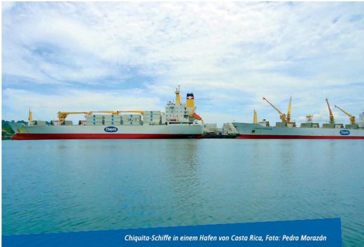
Chiquita-Schiffe in einem Hafen von Costa Rica, Foto: Pedro Morazán