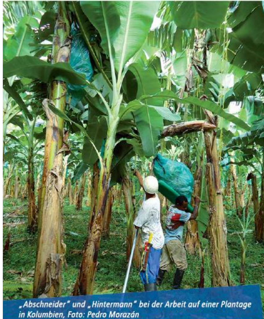
„Abschneider“ und „Hintermann“ bei der Arbeit auf einer Plantage in Kolumbien, Foto: Pedro Morazán