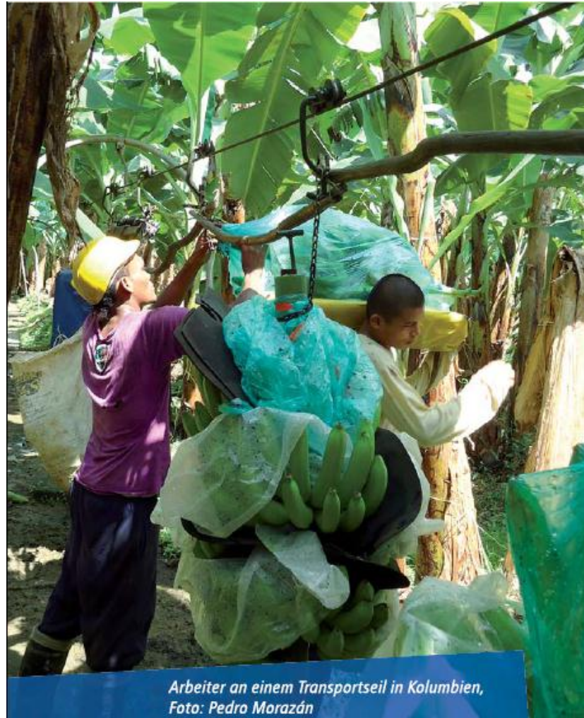
Arbeiter an einem Transportseil in Kolumbien