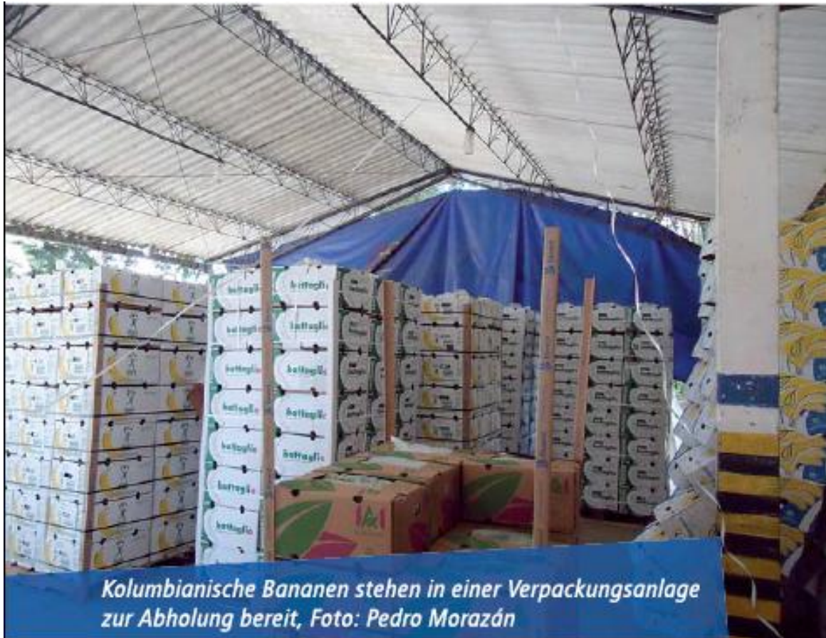
Kolumbianische Bananen stehen in einer Verpackungsanlage zur Abholung bereit