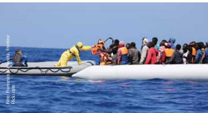
Rettungsaktion der belgischen Marine im Rahmen von Triton, 2015

Richtig und falsch zugleich! Einreisehindernisse wie etwa Visabestimmungen regulieren und kontrollieren Migration in das Zielland. Insofern können sie die Zahl unerwünschter MigrantInnen, die legal einreisen, reduzieren. Sie sind aber zugleich auch kontraproduktiv, da sie Rückkehr-Migration reduzieren und Menschen ohne Chance auf legale Einreisemöglichkeiten nur illegale Möglichkeiten lassen. Sie machen Migrationswege also sowohl teurer als auch länger und gefährlicher. Je höher der Aufwand ist, legal oder illegal in das Zielland zu kommen, desto eher wird aus einer vielleicht nur befristet gedachten Migration eine Dauerlösung: Wer sich zum Beispiel wegen fehlender legaler Einreisemöglichkeiten auf den Weg über das Mittelmeer nach Europa gemacht und damit sein Leben riskiert hat, ist fast schon dazu „verdammte“, dauerhaft in Europa zu bleiben, damit sich dieses hohe Risiko auch gelohnt hat.